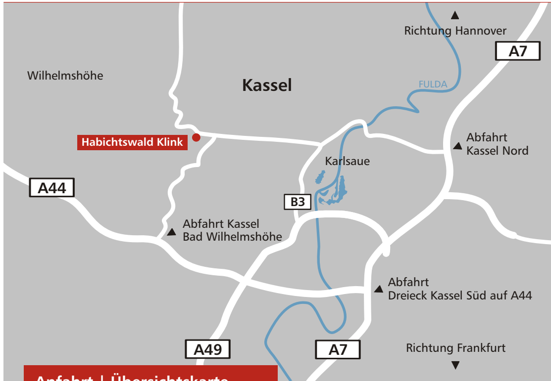
Anfahrt | Übersichtskarte

Telefon 0561 3108-0 Fax 0561 3108-858 E-Mail info@habichtswaldklinik.de Internet www.habichtswaldklinik.de