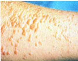
Eine Sonnenallergie kann einem die schönsten Urlaubstage verderben