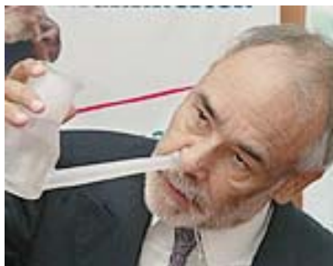
Die Nasendusche – sieht schlimmer aus als es ist und entfernt effektiv Pollen von der Nasenschleimhaut

Wenn diese Tipps noch nicht ausreichen, dann gibt es noch schulmedizinische Medikamente, die antiallergisch wirken. Als Mittel der ersten Wahl würde ich dabei Präparate mit DNCG einsetzen. Dies ist die Abkürzung für Dinatriumchromoglycinsäure. Dieser Stoff wurde erstmals im Bischofskraut (Ammi-visnaga) entdeckt, stammt also praktisch aus der Naturheilkunde. DNCG wirkt nur lokal und