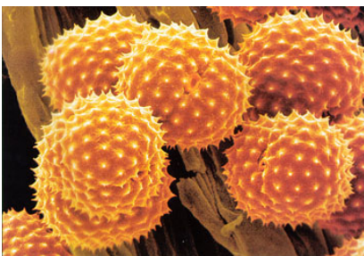
So schön können Blütenpollen aussehen...

Ergänzen können Sie diese homöopathische Vorbeugung durch ein orthomolekulares Programm mit hoch dosierten Nährstoffen. Vitamin C, Magnesium, Kalzium und Zink haben sich als leicht anti-allergisch erwiesen. Eine hohe Zufuhr mit diesen Stoffen hilft die Mastzellen zu stabilisieren (sie können dann weniger gut Histamin freisetzen, welches bei Allergien eine entscheidende Rolle spielt) oder einmal freigesetztes Histamin schneller wieder abzubauen. Damit Nährstoffe gut wirken, müssen sie aber in relativ hohen Dosen eingenommen werden.