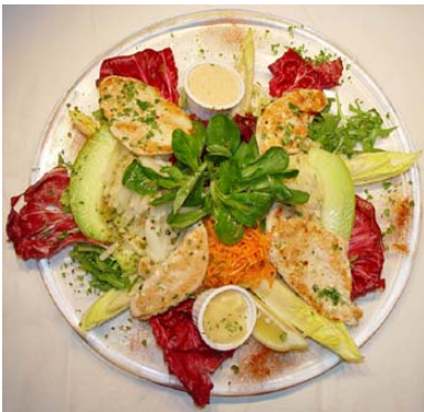
Ein leckerer Salatteller mit Putenbrust – das kann bei entsprechenden Allergien für einen Allergiker zu Blähungen und Durchfall führen

Als Allergie auslösend erkannte Lebensmittel sollten strikt gemieden werden. Wenn eine IgE-vermittelte Allergie nachgewiesen wurde, sollte der Allergiker diese Substanz mindestens zwei Jahre konsequent meiden. Danach kann versucht werden, sie wieder in kleinen Mengen zuzuführen. Wenn dann wieder Symptome auftreten, muss das Lebensmittel ggf. lebenslang gemieden werden. Bei Symptombfreiheit unter Provokation kann es weiter zugeführt werden, aber nicht in großen Mengen und auch nicht öfter als einmal alle fünf Tage. Treten später doch wieder Symptome auf, sollte darauf verzichtet werden.